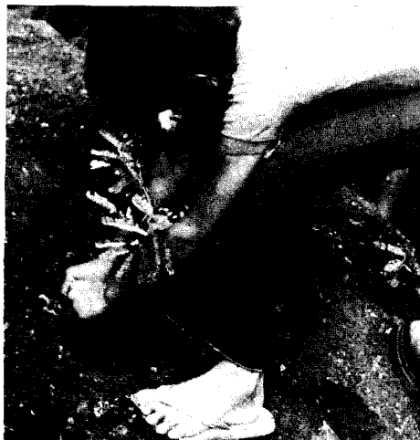
Fiamboyant, avenue de Paris. Voyez aujourd'hui ...

C'est ainsi que toute la zone bordant la route venant de la Possession est bordée de cocotiers.