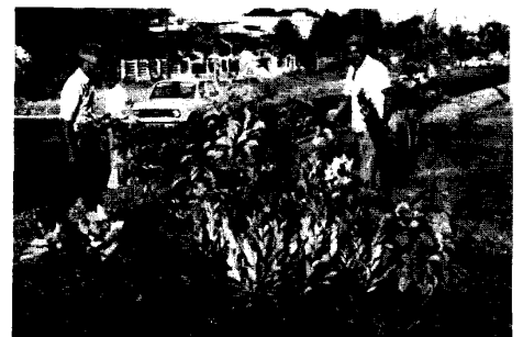
70 000 arbres mis en terre. Ici, avenue de Paris.

extrait de « La danse des textes », revue éditée par la classe de 4ème VI - (C.E.S. du Port).