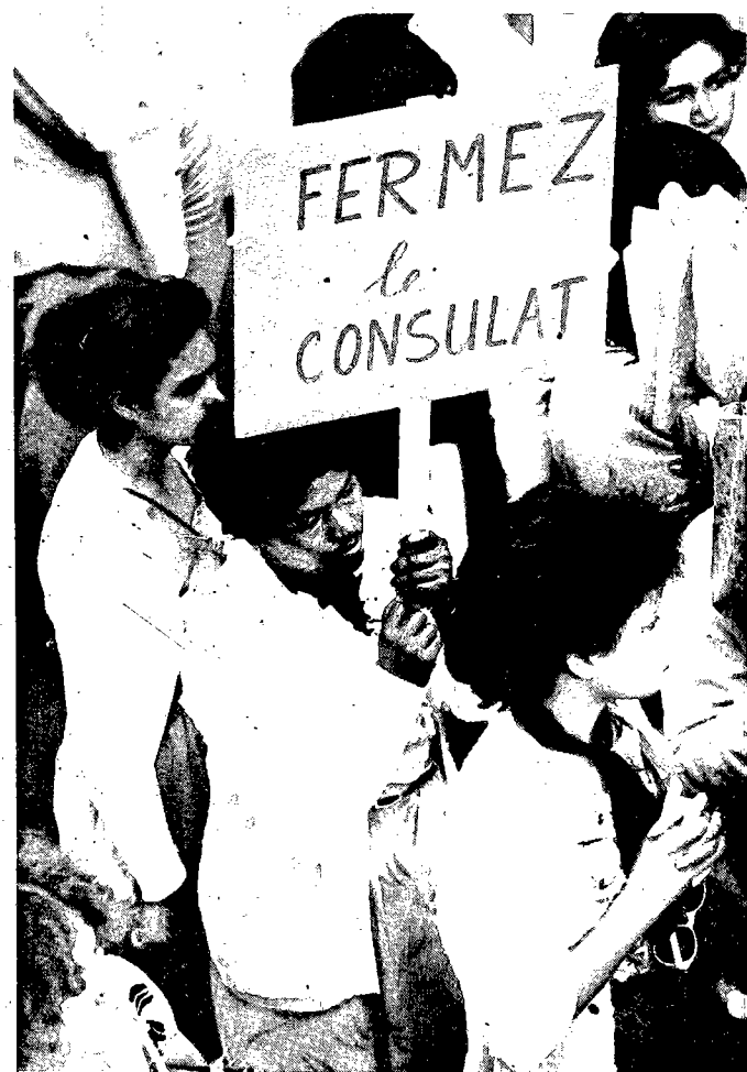
La présence du consulat des racistes sud-africains sur notre sol est une honte pour la Réunion. (Pages 2 et 3)