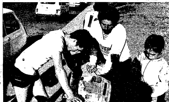
Chaque semaine, le jeudi, la revue des Interquartiers publiée par « Témoignages » passionne les amateurs de football.