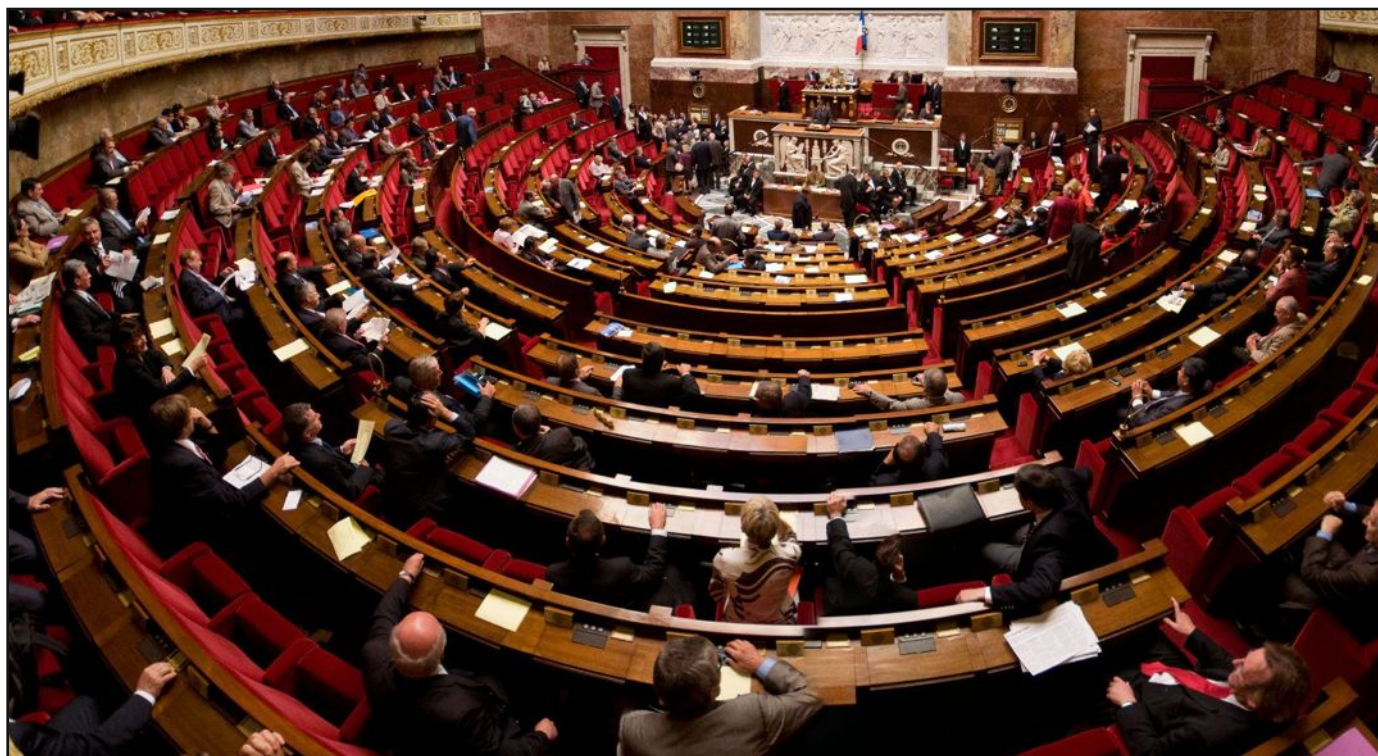
Les députés socialistes partisans d'une politique plus proche des pauvres ont été expulsés de la Commission des Affaires sociales de l'Assemblée nationale. Cette décision souligne le manque de démocratie en France.