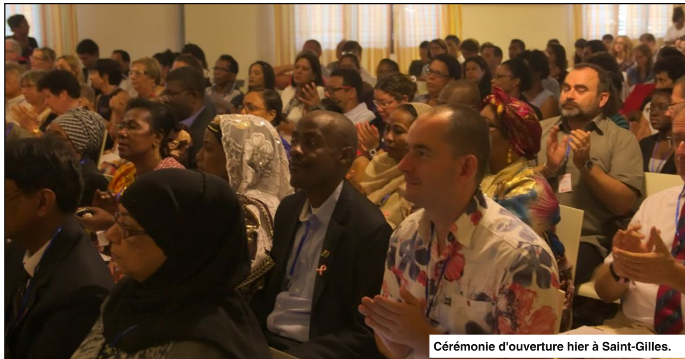
Cérémonie d'ouverture hier à Saint-Gilles.

Depuis hier se tient à l'hôtel Le Recif à Saint-Gilles le 13e colloque VIH/hépatites Océan Indien. Organisée par l'association RIVE Océan Indien avec le soutien du COREVIH, de l'État et des collectivités, la manifestation accueille 300 personnes dont 150 venues des îles voisines. Jusqu'à vendredi, il sera notamment question de l'égalité des soins dans l'océan Indien. Un vaste chantier qui rappelle toute l'importance du co-développement.