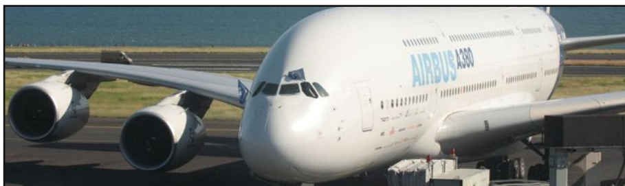
L'Airbus A380 à 800 passagers, la solution réunionnaise au problème du prix du billet d'avion : -30%

Les trois groupes du Conseil Régional ont chacun leur vision de la continuité territoriale, d'un côté, la majorité veut le maintien du dispositif, de l'autre, les socialistes veulent la transparence sur le nombre de bons délivrés, laissant entendre que des revenus de plus de 9.000 euros, aient eu droit à ces bons. Et enfin, l'Alliance souhaite une concertation entre l'État et la Région pour une mise à plat du dispositif.