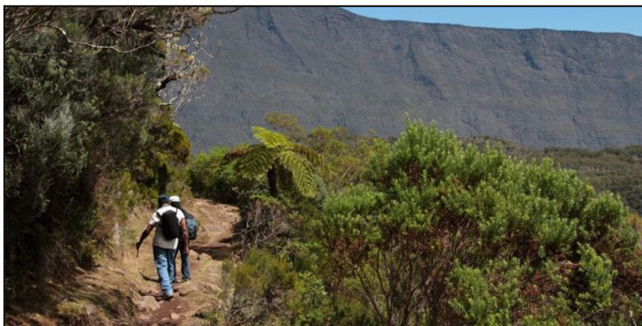
Mafate, un nom légué par les résistants à l'ordre établi qui est aujourd'hui celui d'un cœur de La Réunion.