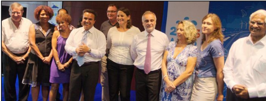
Les élus de la Région présents hier avec Didier Robert.

Hier, le président de Région a présenté ses vœux à la presse. À la veille de l'arrivée de la ministre des Outre-mer, il a présenté un nouveau dispositif financé uniquement par la Région pour subventionner les billets d'avion. En cette année d'élections régionales, le dispositif annoncé concurrence directement celui de l'État en proposant des aides plus importantes.