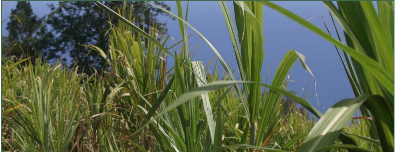
Les surfaces plantées en canne à sucre étaient à l'origine en forêt.

Je suis conscient qu'il y aurait encore beaucoup à écrire sur « la canne au secours de notre environnement ». Je sais aussi qu'à peine élaboré, un dossier est déjà dépassé tant la canne à sucre et ses produits dérivés sont l'objet d'études de plus en plus pointues et de découvertes souvent très étonnantes... La question évoquée ci-dessous est la suivante : la canne à sucre est-elle ou non un facteur de refroidissement du climat ?