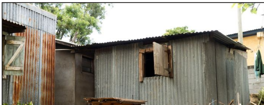
Le Premier ministre reprend le mot d'apartheid pour décrire la situation en France. A La Réunion, Paul Vergès l'utilise depuis longtemps pour souligner que les inégalités dans notre pays découlent de décisions politiques.

En 2005, Manuel Valls avait déjà évoqué les termes de « ghetto », de « ségrégation » et d'« apartheid », alors qu'il était maire d'Evry et en rupture idéologique avec son parti. Dix ans plus tard, il revient avec les mêmes termes pour qualifier la situation des quartiers sensibles en France. Des quartiers considérés comme les lieux propices à la radicalisation de