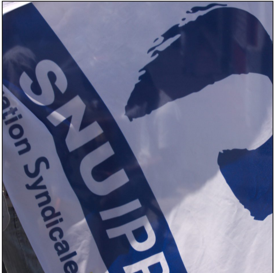
Les enseignants s'opposent à la réduction du nombre de classes.