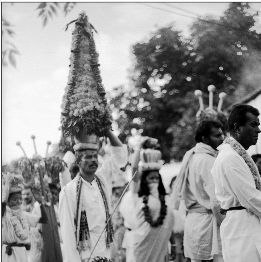
Le 26 avril prochain, le second Congrès Tamoul-Dravidien rappellera aussi les liens entre La Réunion et l'Inde.