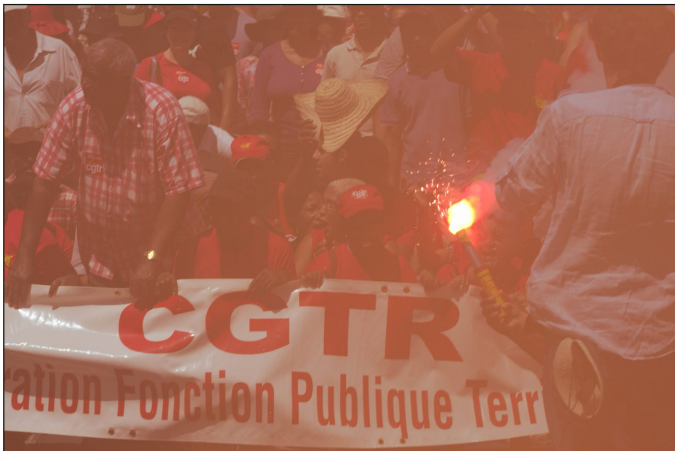
À La Réunion, les syndicats mobilisés aujourd'hui.

Un préavis de grève nationale a été déposé par CGT, FO, FSU et Solidaires pour protester contre la politique d'austérité du gouvernement ce jeudi 9 avril. Cette mobilisation, prévue dès le 17 février, vise à maintenir la pression sur le gouvernement.