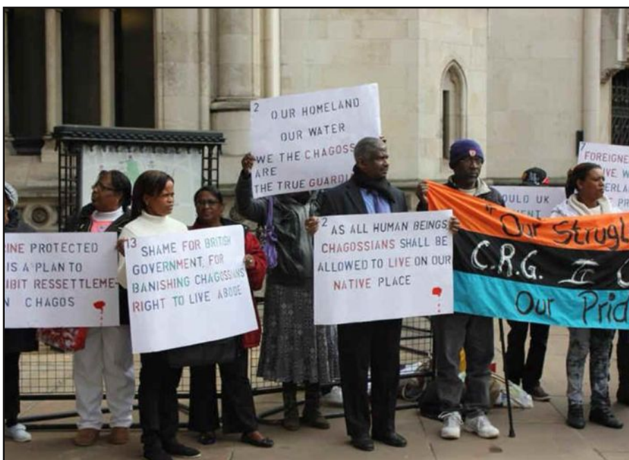
Manifestation chagossienne devant la Haute Cour de Londres, 31 mars 2014