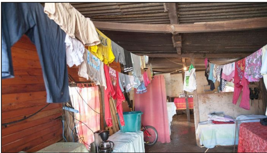
Les Objectifs de développement durable seront applicables dans tous les pays, donc pas seulement dans ceux en voie de développement.

Avec l'achèvement du cycle de 15 ans des Objectifs du millénaire pour le développement, une nouvelle ère s'ouvre à l'ONU avec l'adoption cette semaine d'un plan de développement durable sur 15 ans. Parmi les 17 objectifs figurent la fin de l'extrême pauvreté, la lutte contre les inégalités et le changement climatique. Voici quelques précisions de l'ONU.