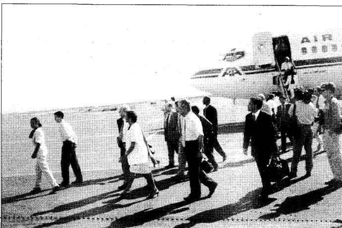
Les premiers voyageurs ravis descendent la passerelle.

Par ailleurs, la poste a ouvert un bureau à l'attention des philatélistes et proposé des enveloppes avec cachets du 19 décembre 98 ainsi que celle du 150 e anniversaire de l'abolition de l'esclavage.