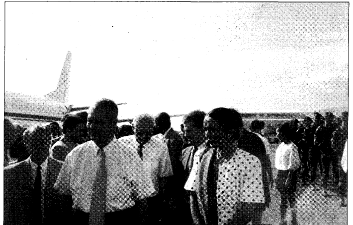
L'arrivée du vol inaugural Saint-Pierre/Pierrefonds : la liaison Saint-Denis/Saint-Pierre réduite à une poignée de minutes.