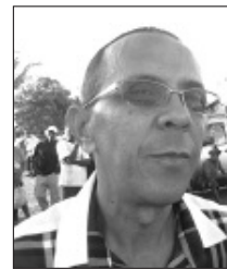
Gevia, Sainte-Suzanne : «Beaucoup pour notre commune».