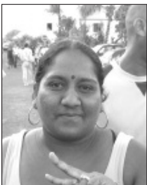
Mauricia : «Il n'a jamais tourné le dos».