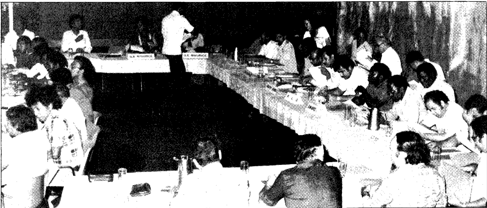
Vue partielle de la salle de Conférence. Au premier plan de dos, la délégation Réunionnaise. A droite, la table des observateurs. A gauche, la délégation Malgache. Au fond les délégations Mauriennes et Seychelloises.