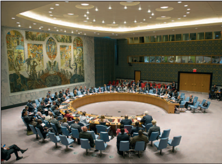
Le Conseil de sécurité de l'ONU a consacré une séance à la situation du Liberia.