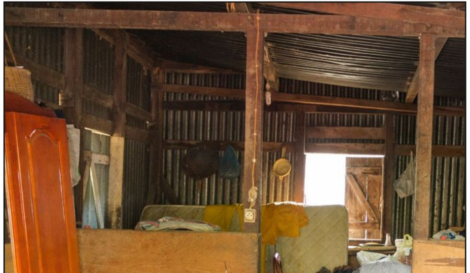
Situation hors norme.