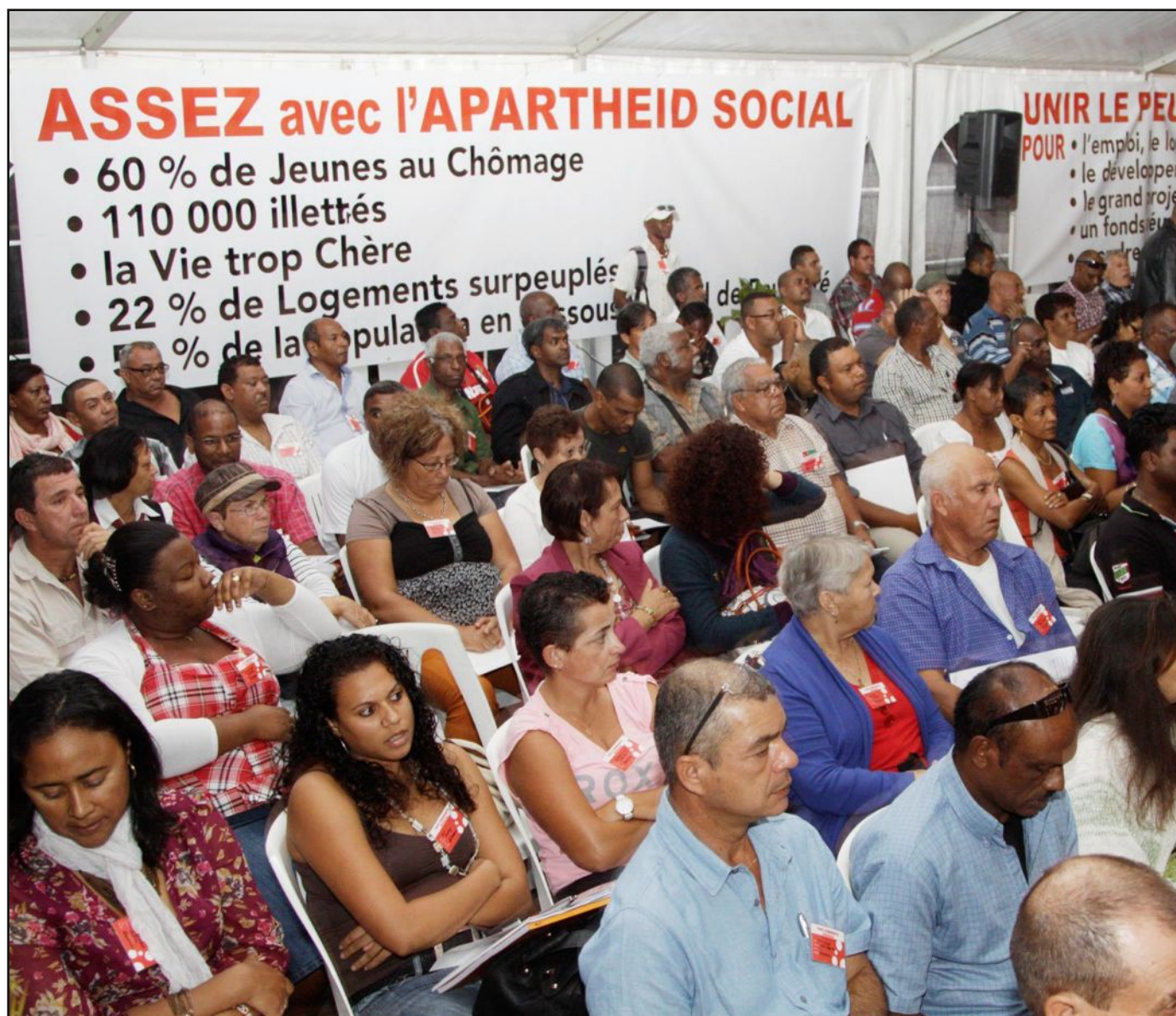
Lors de son dernier congrès en 2013, le PCR avait fait de la lutte contre l'apartheid social un de ses mots d'ordre principaux.

Le Parti communiste réunionnais donne rendez-vous demain à Sainte-Suzanne pour présenter ses propositions en vue d'un grand débat avec toutes les bonnes volontés pour construire l'avenir de La Réunion.