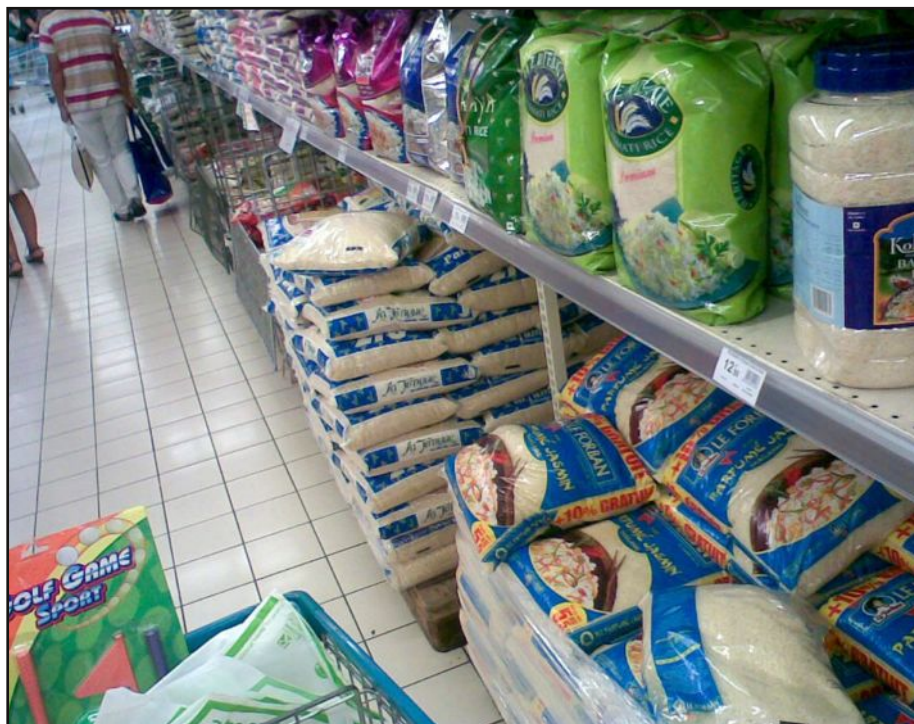
La déflation entraîne une diminution des recettes des impôts, et amène à diminuer encore plus les dépenses au nom du respect de l'équilibre budgétaire.

L'Insee vient d'annoncer le recul des prix à la consommation de 0,4 % sur un an, cette donnée entraîne sur le long terme une déflation du pays. Une situation alarmante pour les économistes, car la déflation peut durer plusieurs années et enfermer dans un cercle vicieux les entreprises et les ménages qui reporteront leurs achats de bien.