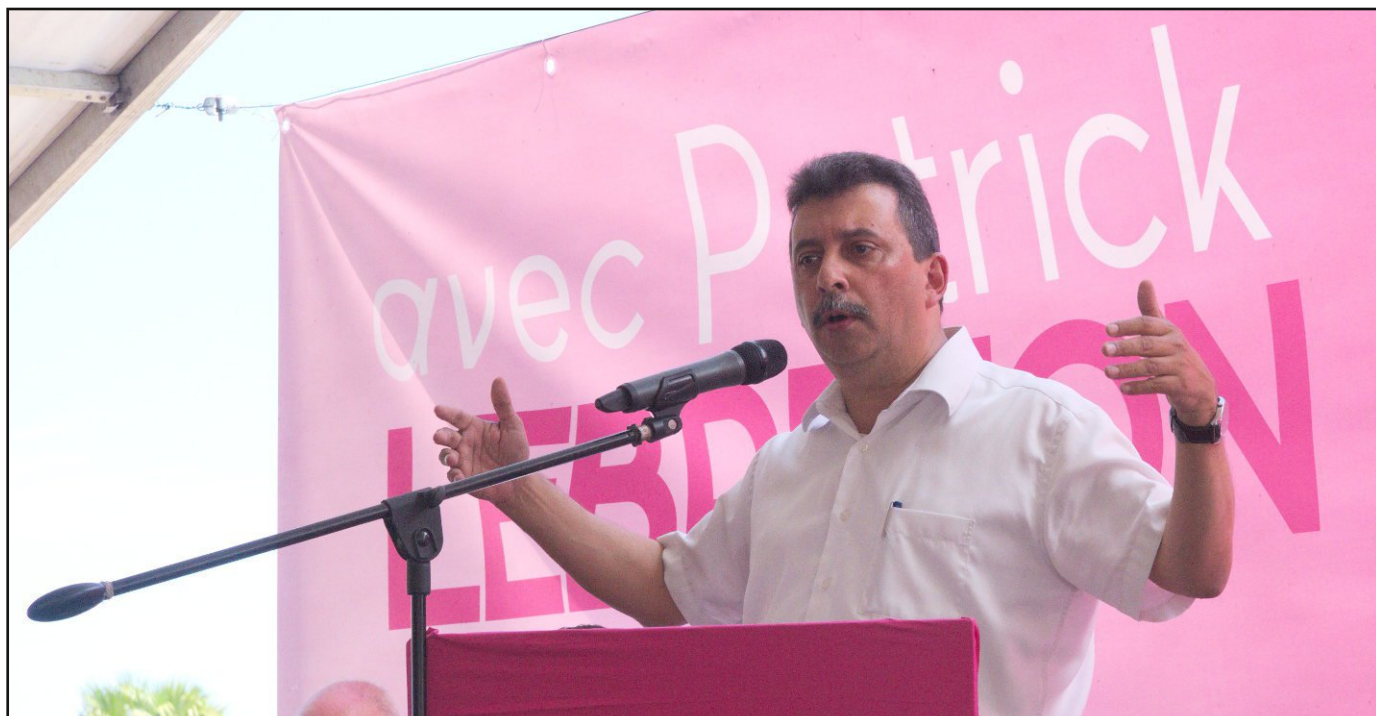
Patrick Lebreton, tête de liste de l'Union des Forces de Progrès pour le Développement et l'Égalité.