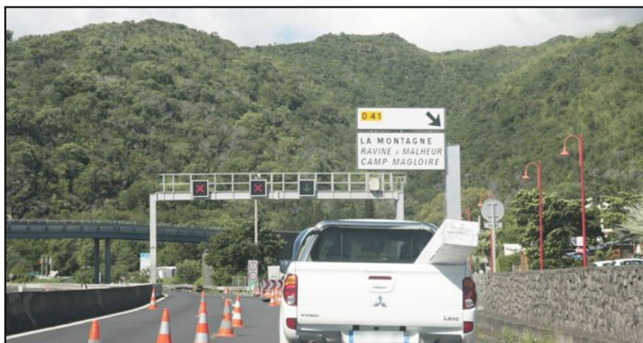
Depuis hier, la route du littoral est fermée jusqu'à nouvel ordre, tout le trafic est dévié par la Montagne.

Jusqu'en 2010, les infrastructures construites après cette signature ont tenu compte de cette données.