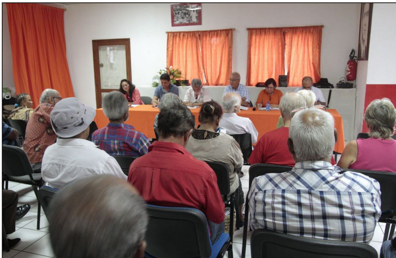
Vue d'une partie de la salle hier au Port.

Après Saint-Suzanne la veille, une seconde assemblée générale préparatoire au 9e Congrès du PCR avait lieu hier au Port. Elle a regroupé les Sections de l'Ouest. Les débats vont permettre d'enrichir les thèses qui fixeront les orientations du Parti communiste réunionnais.