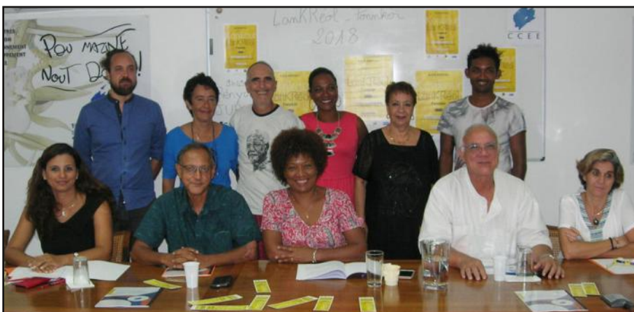
Les organisateurs du concours “LanKRéol - Fonnkèr 2018” et les membres du jury.