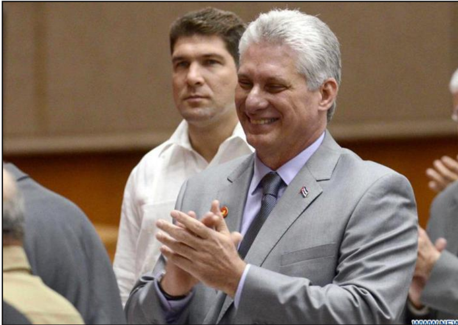
Miguel Díaz-Canel, nouveau président de Cuba.