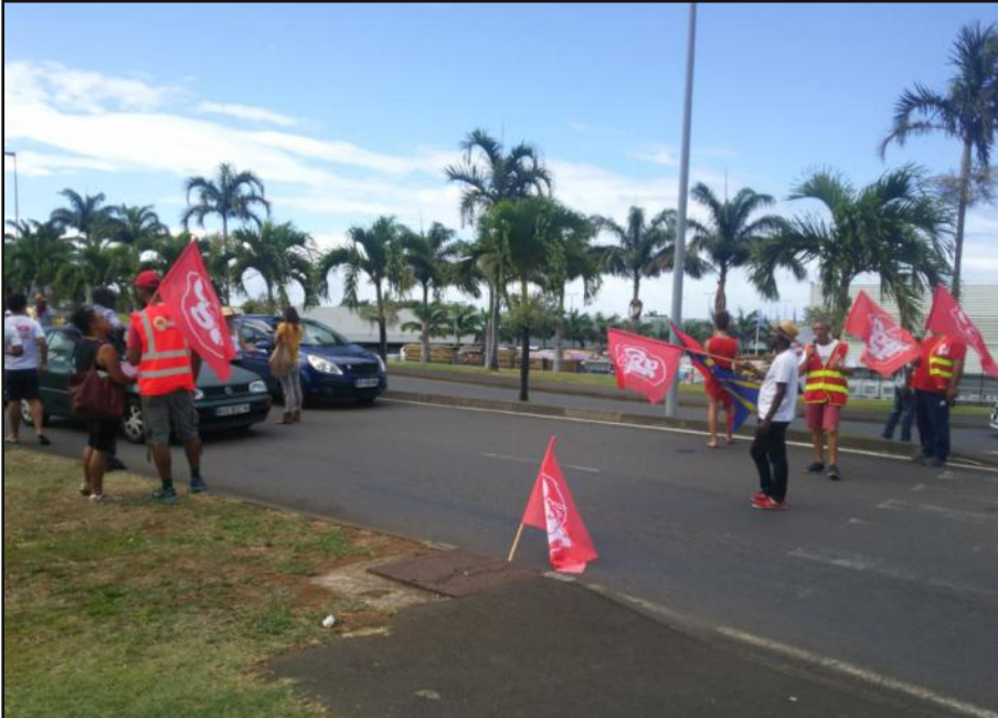
Manifestation hier à Saint-Pierre pour un 20 décembre chôme et payé.

La CGTR a lancé hier une pétition adressée au préfet, aux élus et maire de La Réunion, et au président du Conseil régional. Voici le texte :