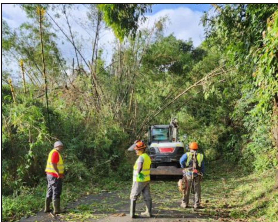
Depuis hier à Sainte-Suzanne, les agents mobilisés pour réparer les dégâts considérables du cyclone.

Les Réunionnais viennent de subir le passage du cyclone Belal. Cela fait de nombreuses années que nous avons été épargnés, contrairement à notre voisin Madagascar. Cette fois, c'est à Maurice que les pluies diluviennes ont provoqué des inondations et causé d'immenses dégâts. Le PCR demande aux autorités françaises et aux Institutions réunionnaises d'apporter aux autorités mauriciennes la solidarité nécessaire compte tenu de la gravité de la situation. Comme nous venons de fêter les 40 ans de la COI, nous souhaitons que le Ministre de l'Intérieur et des Outre-mer en fasse les annonces. En particulier, des facilités aériennes seront accordées aux Mauriciens qui veulent venir en aide à