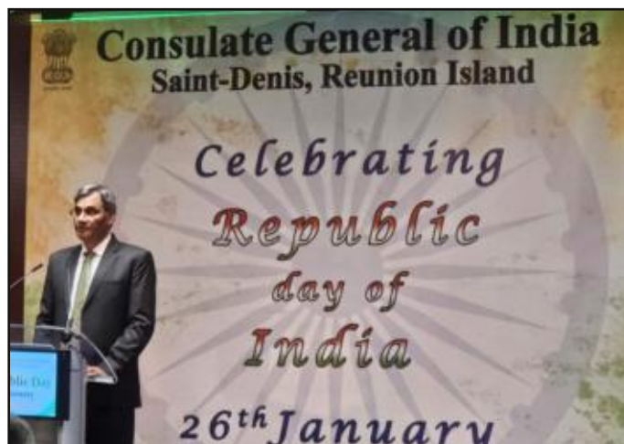
A l'occasion du 77 ème « Republic Day », le Consul Général de l'Inde M. Bhupendra Singh a rappelé les progrès réalisés par le pays depuis son accession à l'indépendance

Au fil des décennies, l'Inde a engagé des réformes structurelles majeures, stimulant l'innovation et attirant les investissements internationaux. Ces transformations ont permis l'émergence d'un tissu industriel et technologique dynamique, faisant de l'Inde un acteur incontournable dans des secteurs clés tels que les technologies de l'information, l'espace, la pharmacie, les énergies renouvelables et l'industrie manufacturière.