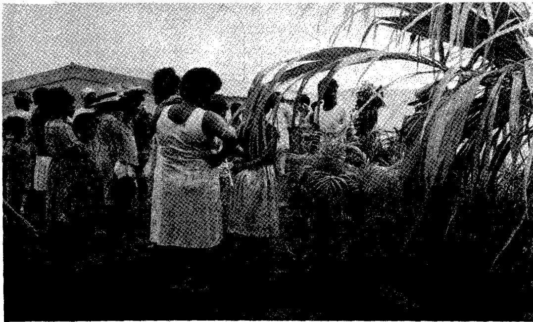
Chacun attend ses plants arrivés tout droit de la pépinière municipale.