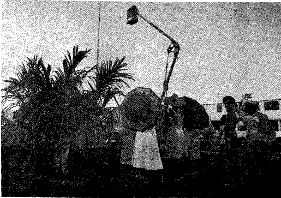
Pendant qu'à terre on s'apprête à planter, en l'air on pose l'éclairage public.

Dans les conversations autour des pieds de bois, une chose revenait souvent : «Anou forme nout association locataires !» Un projet qui se réalisera rapidement à n'en pas douter.